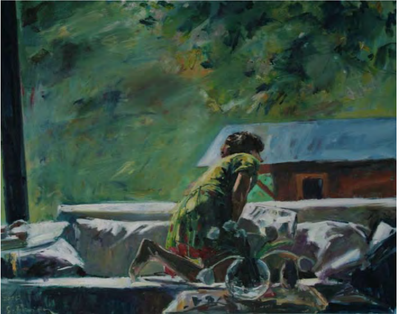
Panorama , 2010, Öl auf Leinwand, 100 x 80 cm