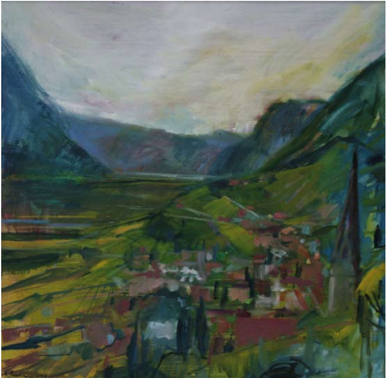
Blick auf Tramin , 2009, Öl auf Leinwand, 80 x 80 cm