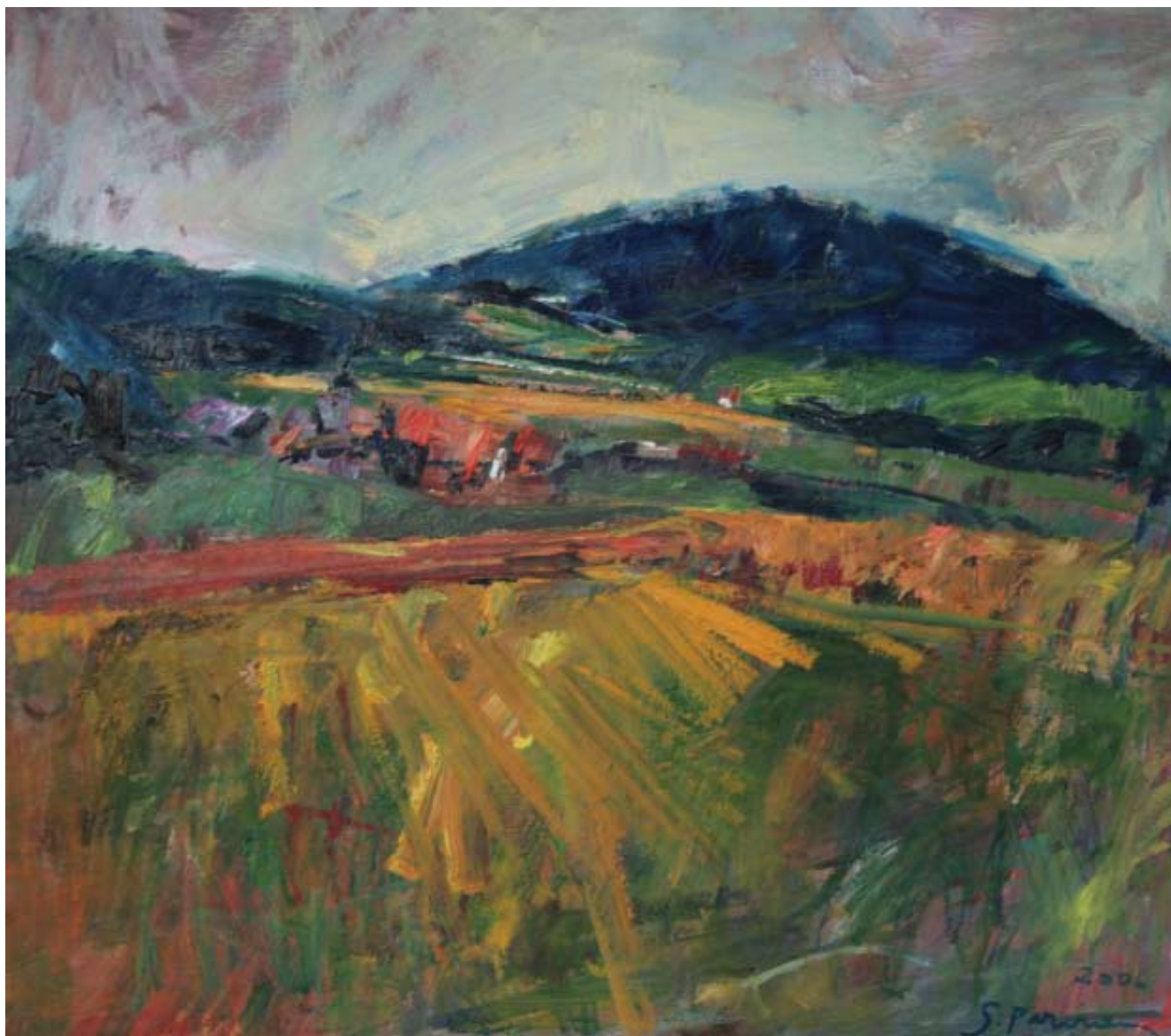
Pulgarn , 2006, Öl auf Holz, 80 x 70 cm