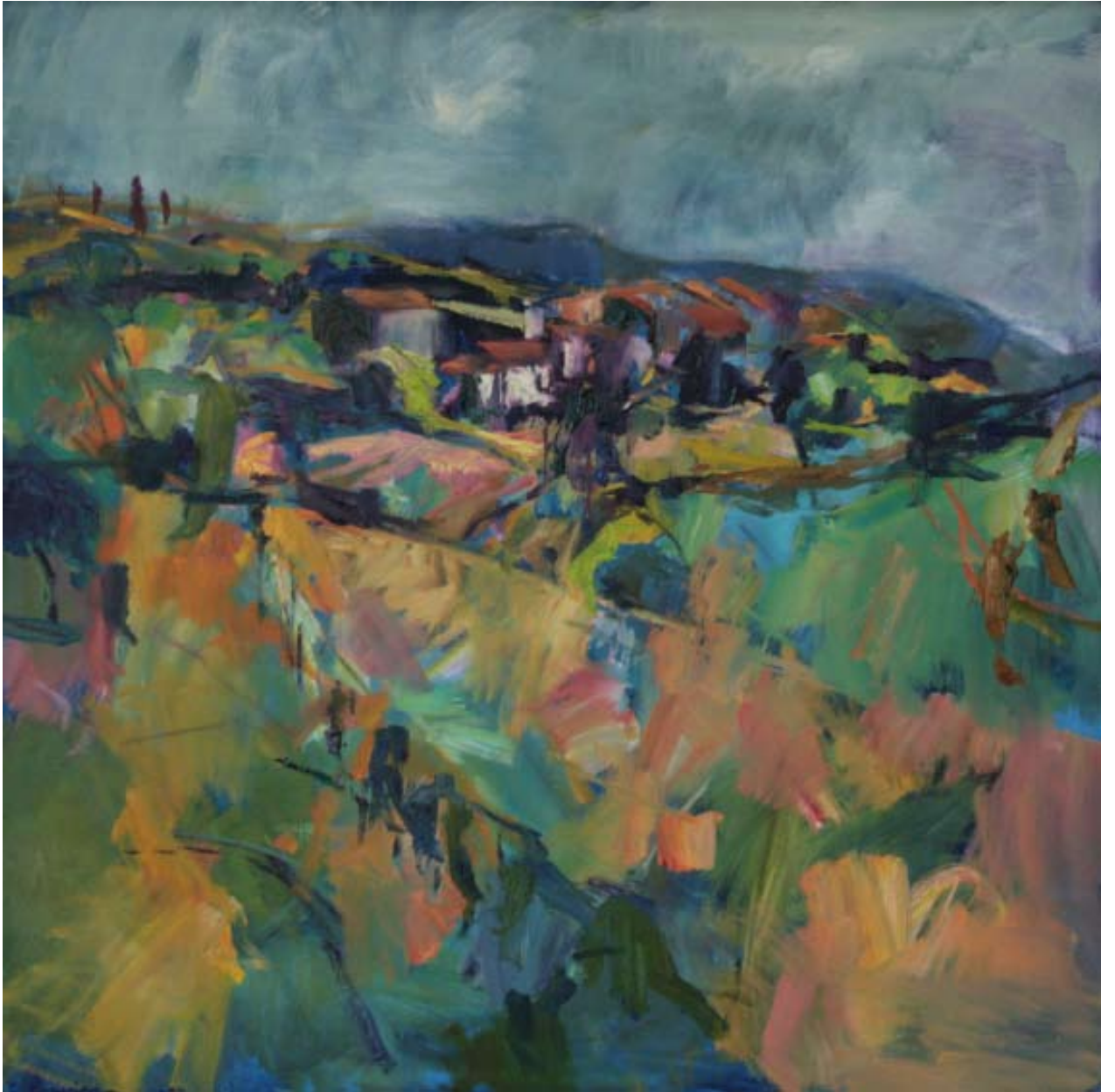
Bei Cereda , 2010, Öl auf Leinwand, 80 x 80 cm