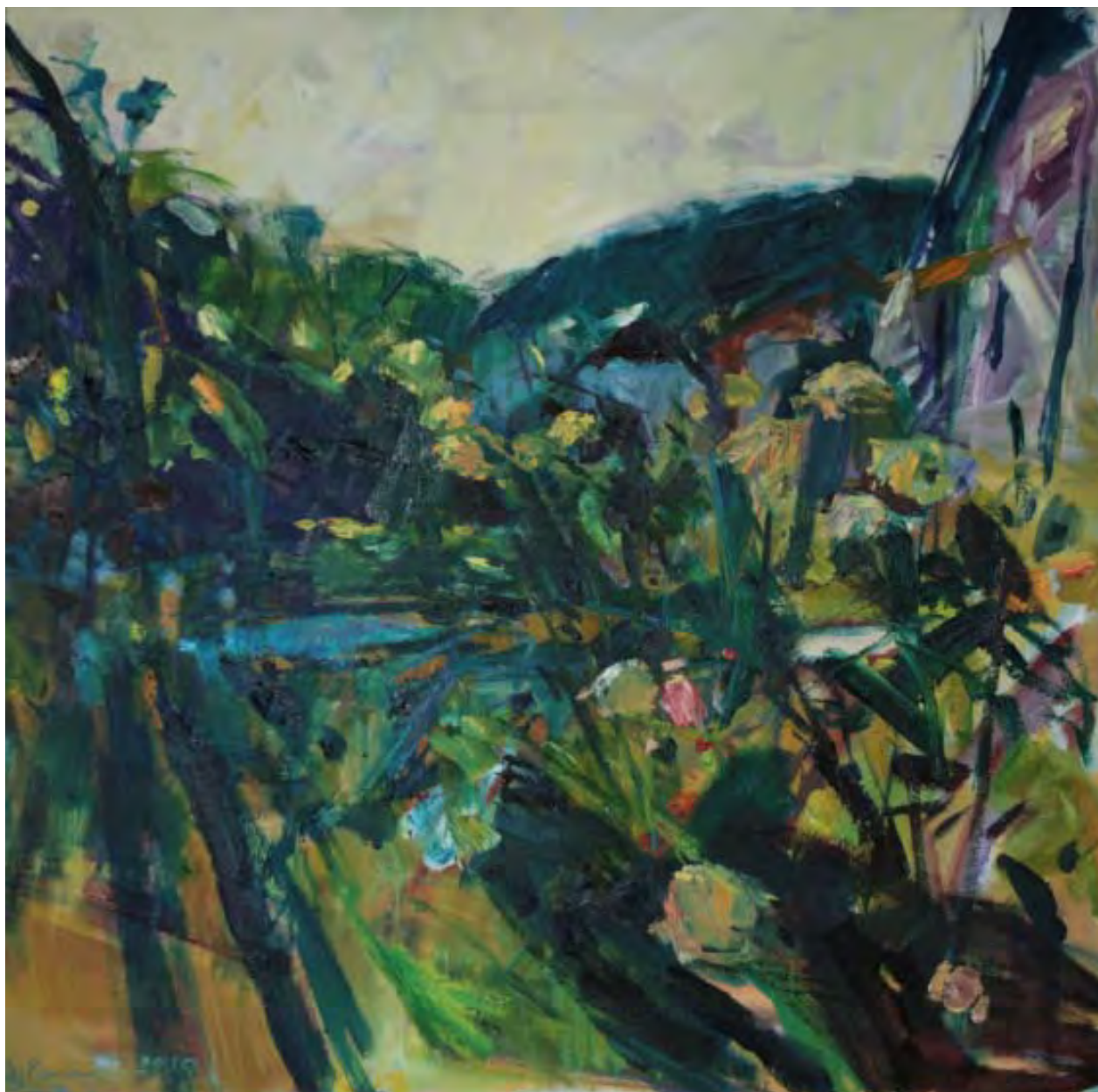
Rosen im Gegenlicht , 2010, Öl auf Leinwand, 80 x 80 cm