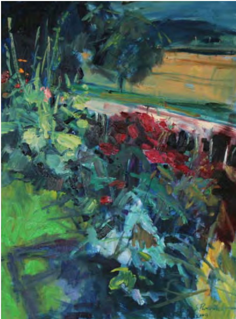
Am Zaun , 2009, Öl auf Leinwand, 60 x 80 cm