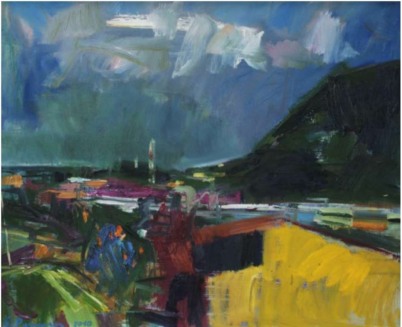
Blick auf Malo , 2010, Öl auf Leinwand, 60 x 50 cm