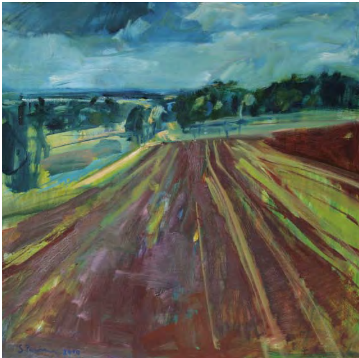
Gewitter im Latrium , 2010, Öl auf Leinwand, 80 x 80 cm