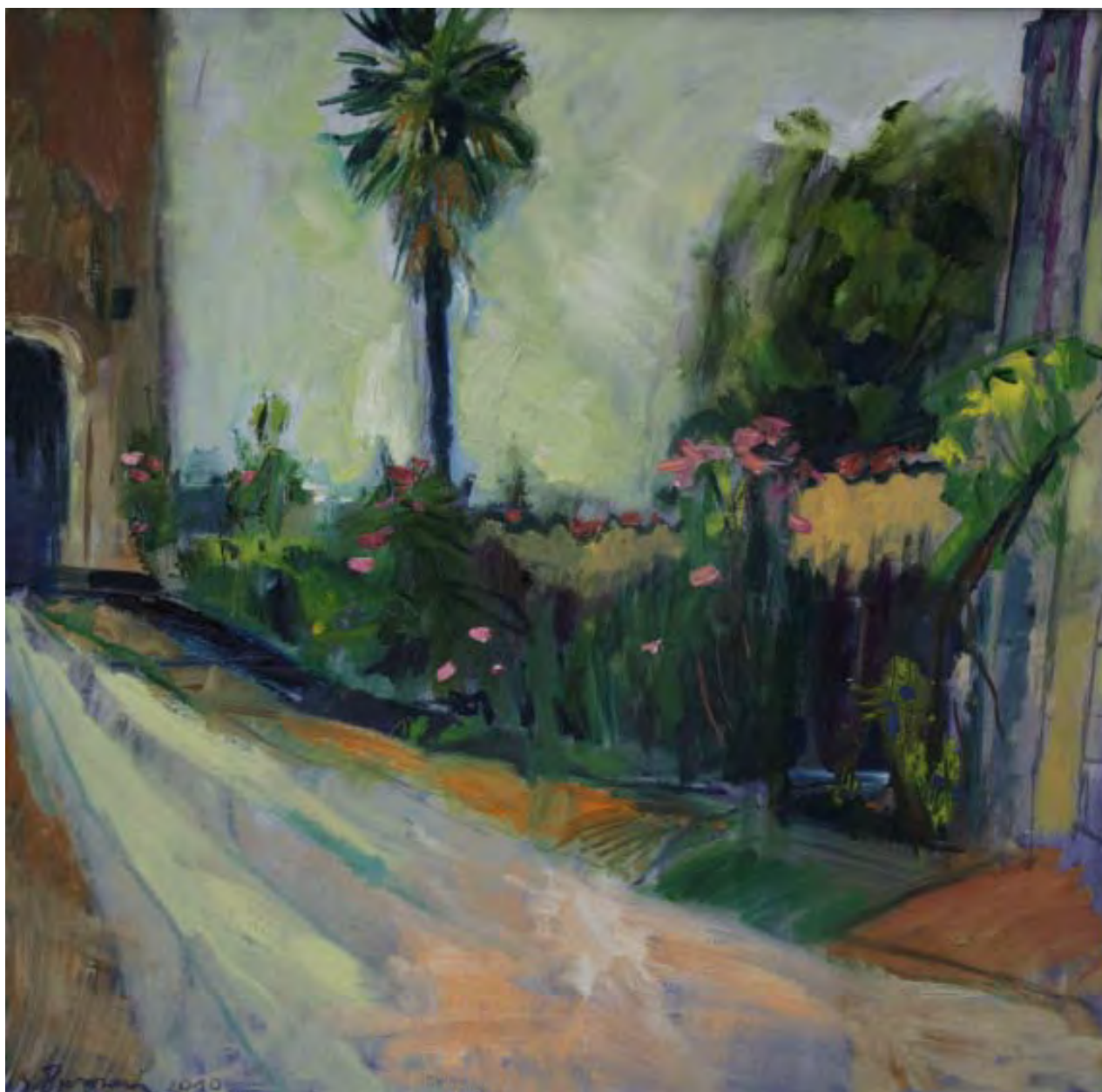
Bei der Chesetta di Santa Lucia , 2010, Öl auf Leinwand, 80 x 80 cm