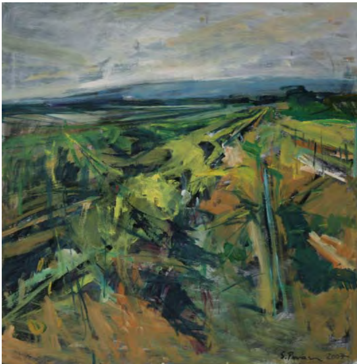
Weingärten, 2007, Öl auf Leinwand, 80 x 80 cm