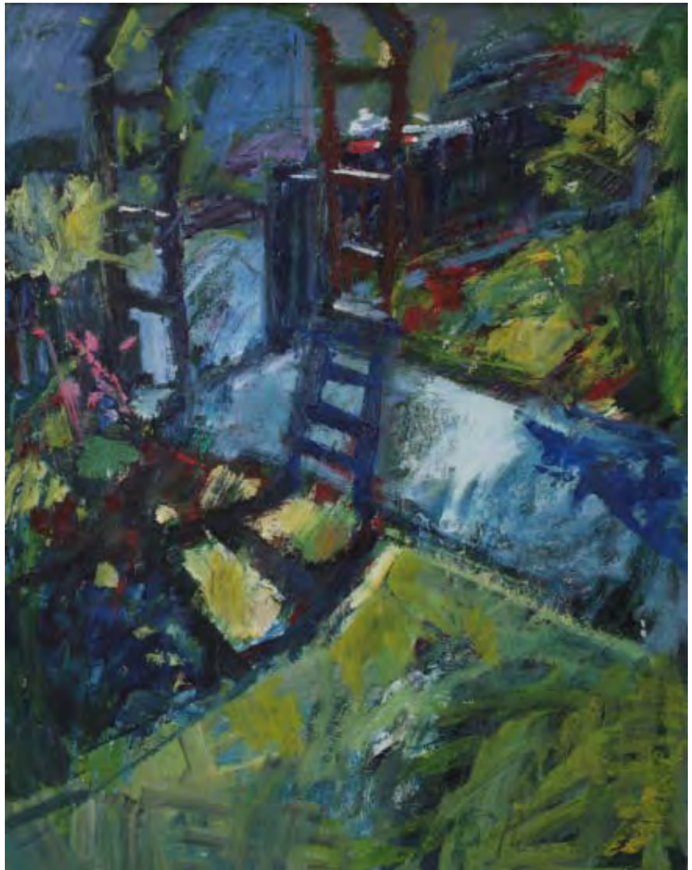
Gartenbogen, 2005, Öl auf Holz, 55 x 70 cm