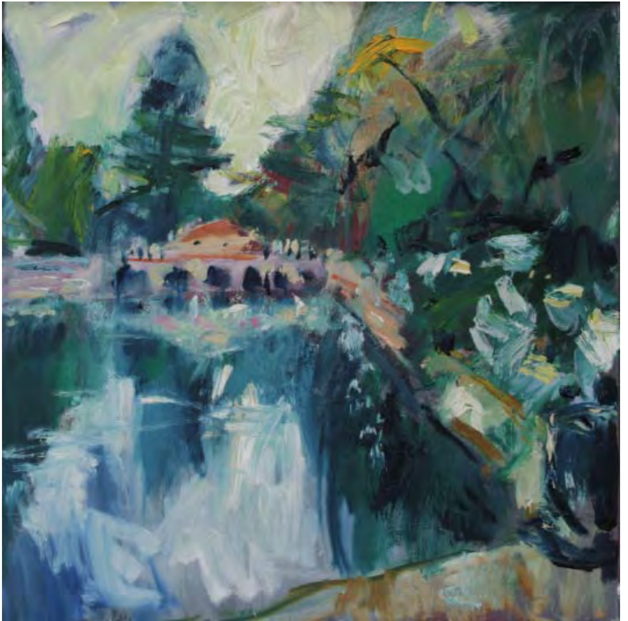
Schloßteich , 2009, Öl auf Leinwand, 50 x 50 cm