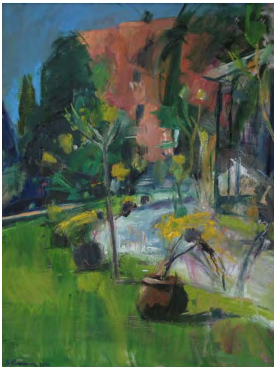
Villa di Sforza Bessara , 2010, Öl auf Leinwand, 60 x 80 cm