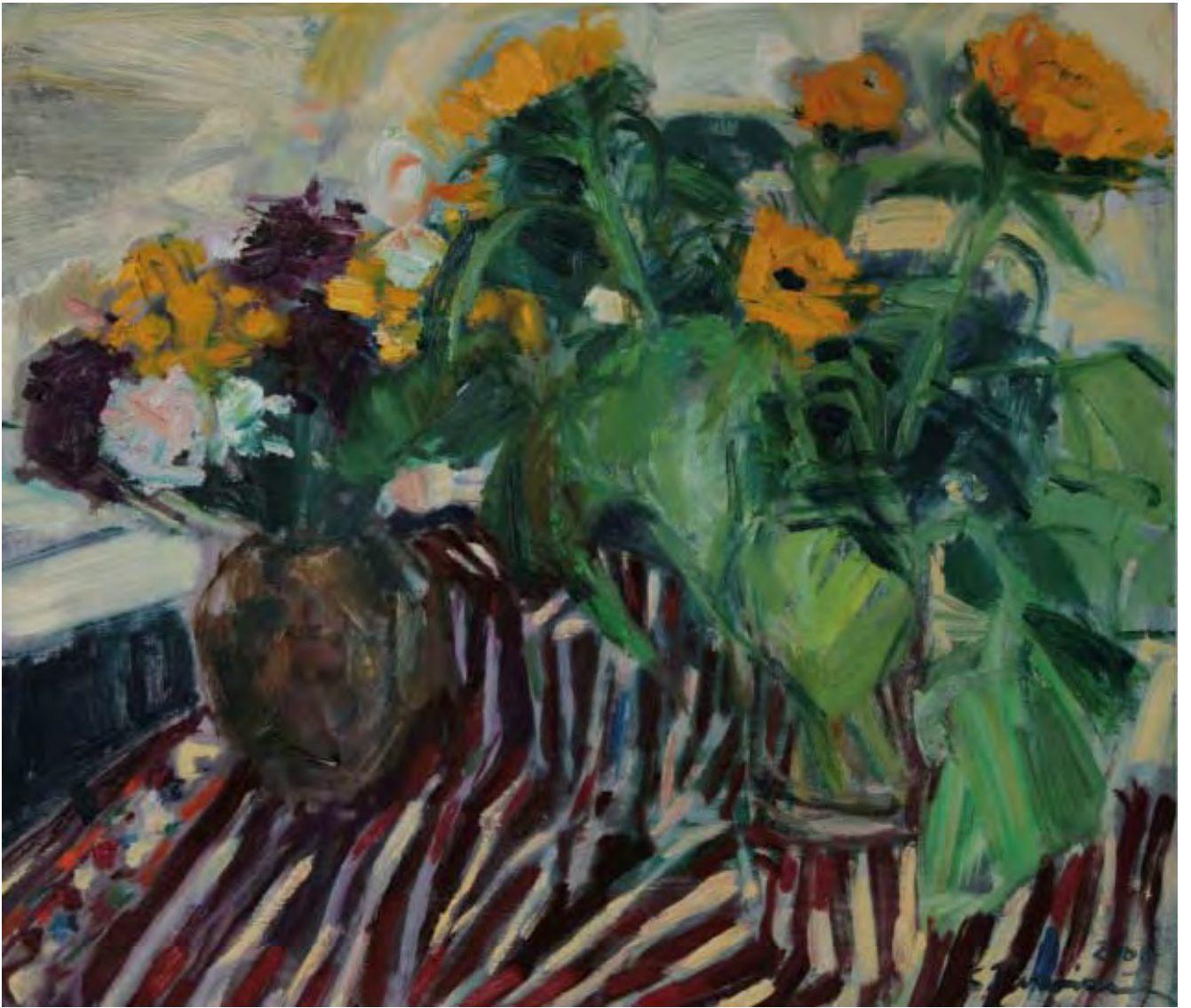
Stilleben mit Sonnenblumen , 2009, Öl auf Leinwand, 70 x 60 cm