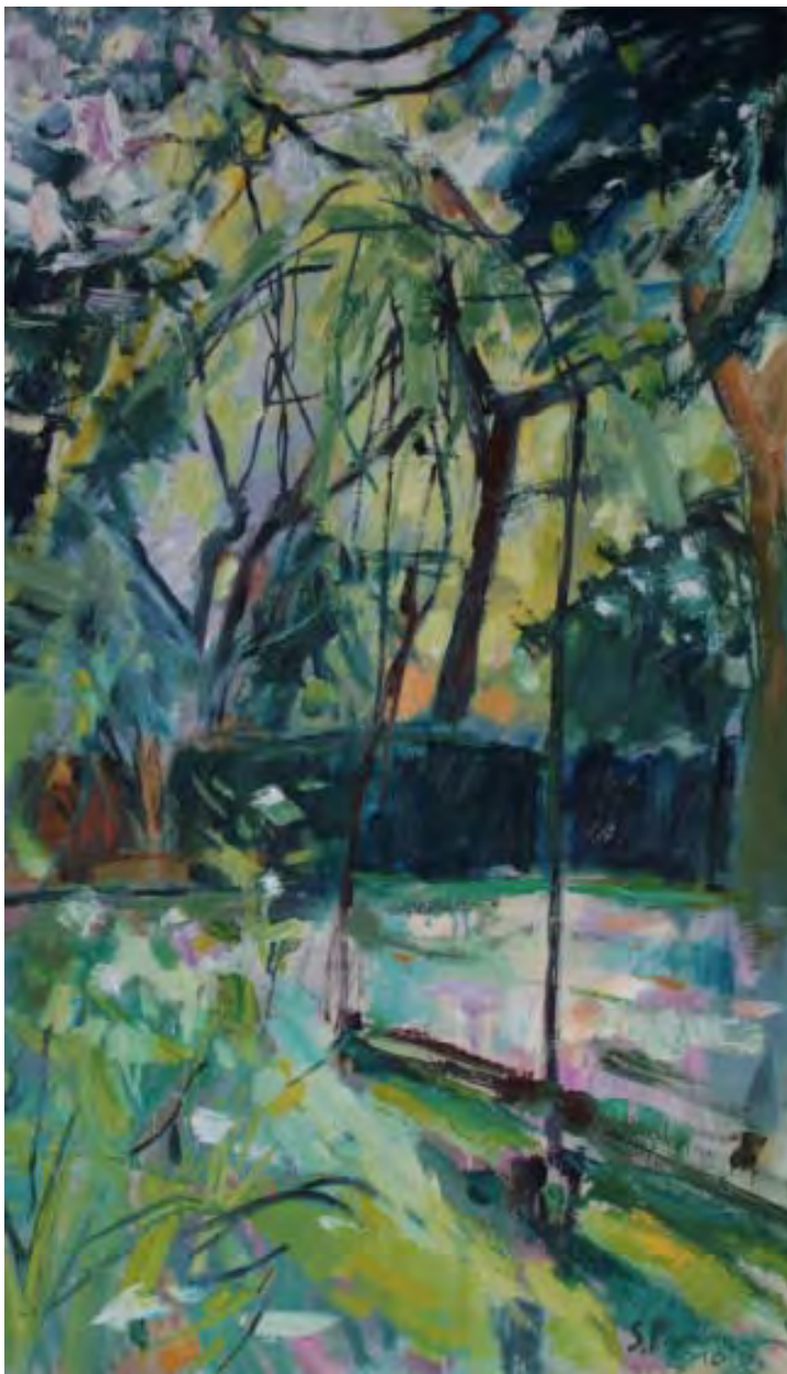
Magnolie , 2010, Öl auf Leinwand, 60 x 100 cm