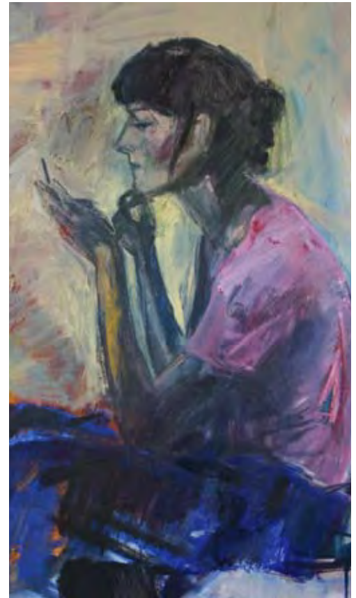
Malerin mit Modell (Ausschnitt), 2007, Öl auf Leinwand, 100 x 80 cm