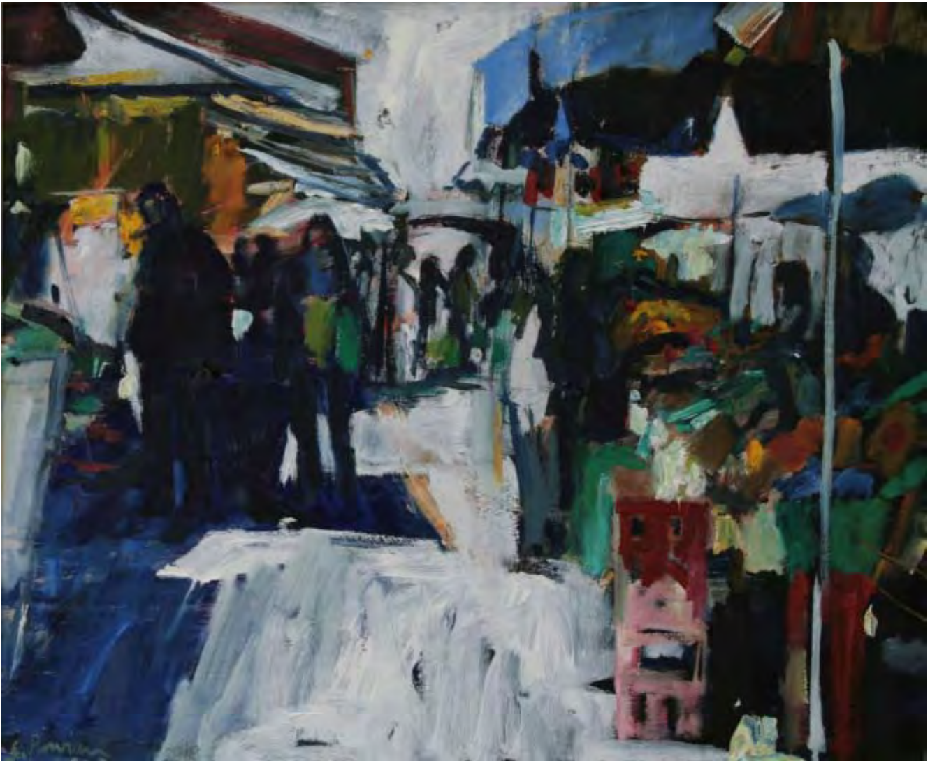
Markt , 2010, Öl auf Leinwand, 60 x 50 cm