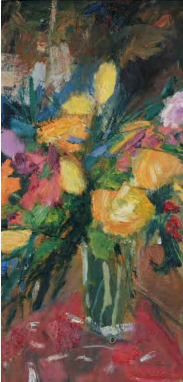
Frühlingsblumen , 2010, Öl auf Leinwand, 30 x 60 cm